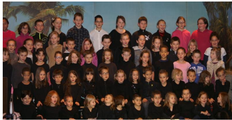
Spectacle de Noël.